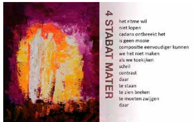
Uit: Kruisweg 'Schouwen', van Heleen de Lange

Op 17 april vieren we Witte Donderdag, aanvang 19.30 uur. We lezen een zogenaamde evangeliënharmonie, zoals het orthodoxe leesrooster aanreikt voor de Stille Week. Dat zijn teksten uit de evangeliën van Mattheus, Lucas en Johannes, die samen vertellen over de tijd van Jezus' aankondiging van zijn dood tot en met zijn arrestatie en overlevering aan Pontius Pilatus, tijd ook van de voetwassing en het Pesach maal van Jezus en zijn leerlingen. We vieren samen de Maaltijd van de Heer en zoals gebruikelijk op Witte Donderdag, zal de viering in een kring of aan tafel plaatsvinden.